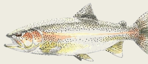
Truite arc-en-ciel (TAC)